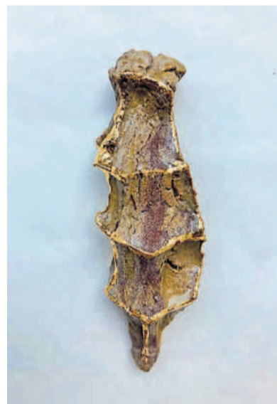
'Fijn kneepje nr. 2'

Nynke Deinema: 'Het landschap deed me aan Mongolië denken'