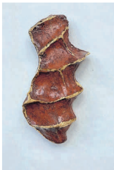
'Fijn kneepje nr. 1'